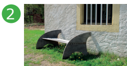
2 Devant le bureau des forges Kris Rabaut

Installations accessibles en permanence (extérieur) ou sur demande