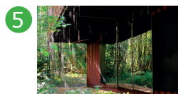
5 Côté gauche Espace René Greisch Valérie Vogt