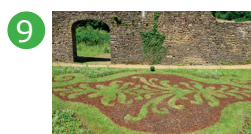
9 Halles à charbon Aurélie Slonina (*)