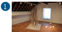
1 Bureau des forges Rez-de-chaussée + étage Evelyne de Behr

Exposition accessible du vendredi au dimanche de 14h30 à 18h et sur rendez-vous