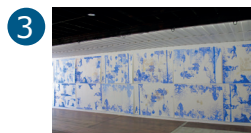
3 Espace René Greisch 1 er étage Dany Danino