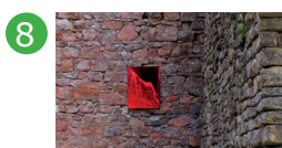
8 Halles à charbon Bernard Gilbert (*)