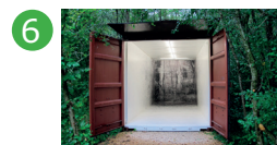
6 Pavillon Accessible sur demande Bertrand Flachot