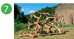
7 Espace butte Samuel D'Ippolito (*)