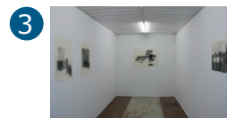
3 Espace René Greisch 2 e étage Ida Ferrand

Installations accessibles en permanence (extérieur) ou sur demande