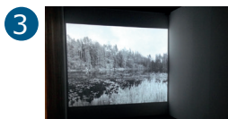
3 Espace René Greisch Rez-de-chaussée Hélène Petite