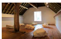
Bureau des forges Hughes Dubuisson