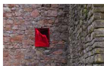
Halles à charbon Bernard Gilbert