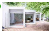
Musée lapidaire Philippe Luyten