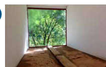
Espace René Greisch 2 e étage Claude Cattelain