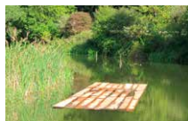
Étang Claude Cattelain