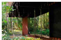
Côté gauche Espace René Greisch Valérie Vogt