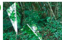
Espace extérieur - autour des arbres Valérie Vogt