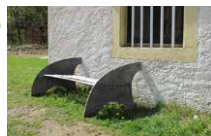
Devant le bureau des forges Kris Rabaut