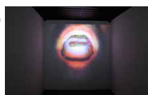
Espace René Greisch Rez-de-chaussée Claude Cattelain