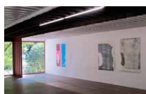
Espace René Greisch 1 er étage Yonghi Yim