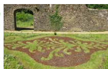
Halles à charbon Aurélié Slonina