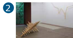
2 Espace René Greisch 1 er étage Surya Ibrahim