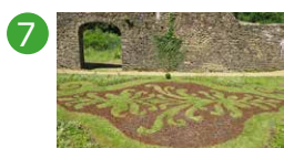
7 Halles à charbon Aurélie Slonina