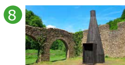
8 Halles à charbon Bento / Futur Primitif