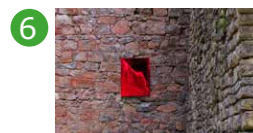
6 Halles à charbon Bernard Gilbert