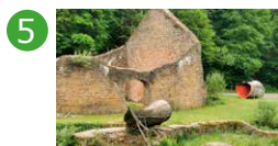
5 Espace extérieur - à proximité des halles Didier Mahieu