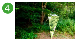
4 Espace extérieur - autour des arbres Valérie Vogt