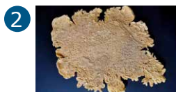
2 Espace René Greisch Rez-de-chaussée Roxane Métayer