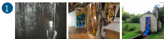
1 Bureau des forges Julia Lebrao Sendra / Matthieu Marre

Exposition «M/Ondes» accessible le mercredi, samedi et dimanche de 14h à 18h