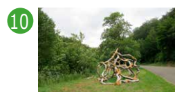
10 Devant l'étang Samuel D'Ippolito