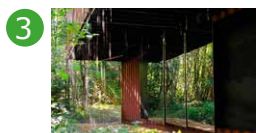
3 Côté gauche Espace René Greisch Valérie Vogt