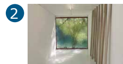
2 Espace René Greisch 2 e étage Hannah De Corte