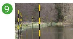
9 Etang Laurent Trezegnies