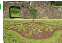
Halles à charbon Aurélie Slonina