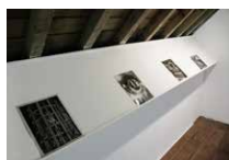
Bureau des forges Etage Rokko Miyoshi