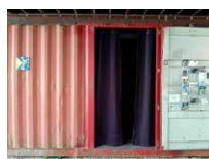
Espace René Greisch Rez-de-chaussée Julie Krakowski