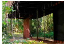
Côté gauche Espace René Greisch Valérie Vogt