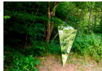
Espace extérieur - autour des arbres Valérie Vogt