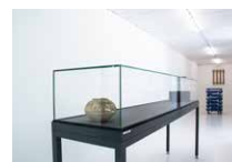
Espace René Greisch 2 e étage Rokko Miyoshi