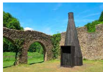
Halles à charbon Bento