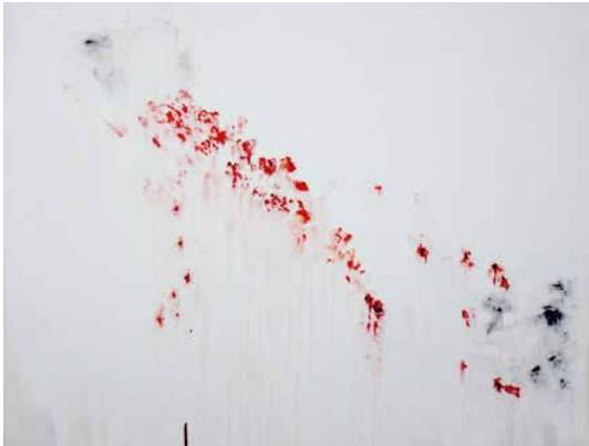
ARIÉ MANDELBAUM PEINTURE