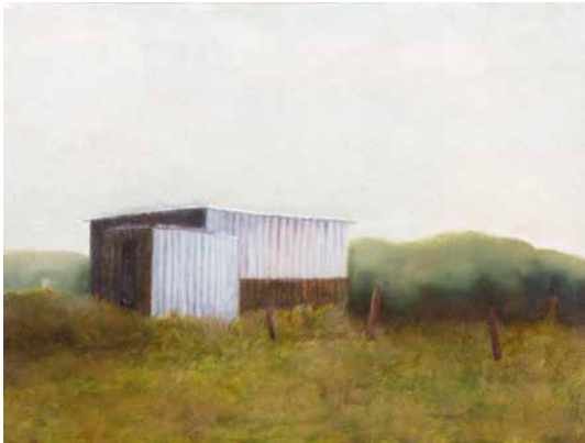
DOMINIQUE COLLIGNON PEINTURE