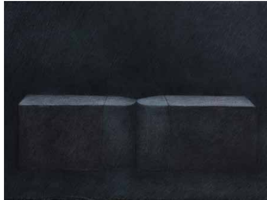
JEAN-MICHEL FRANÇOIS PEINTURE