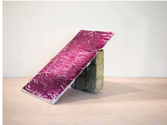
SIMON DALEMANS SCULPTURE