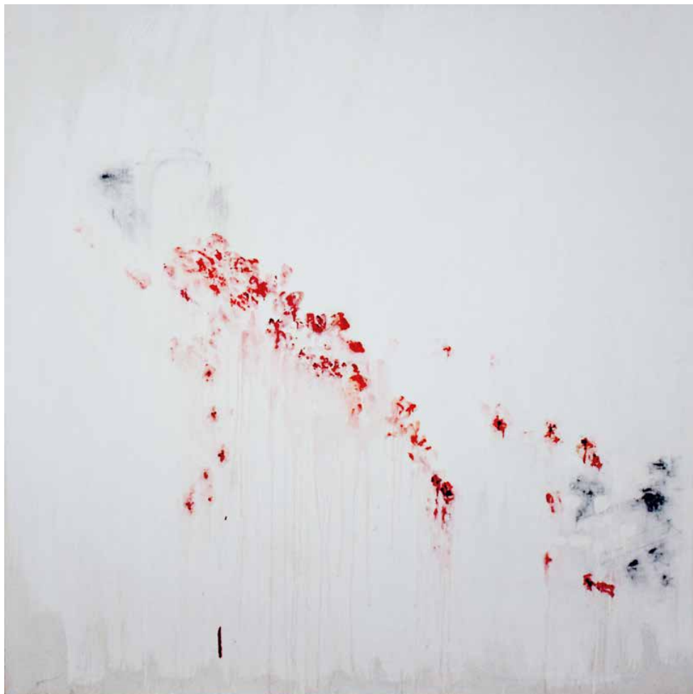
Arié Mandelbaum, «Sans Titre», 2015, technique mixte (tempéra et fusain), 200 x 200 cm

Né en 1939, Arié Mandelbaum vit et travaille entre Bruxelles et Fontenoille. Lauréat de la Fondation belge de la vocation, il a étudié à l'Académie des Beaux-Arts de Bruxelles et enseigné à l'École des arts d'Uccle de 1966 à 2004. Son parcours compte de nombreuses expositions personnelles en Belgique, des expositions à l'Étranger et des œuvres figurant parmi des collections. Plusieurs livres et films lui sont consacrés.