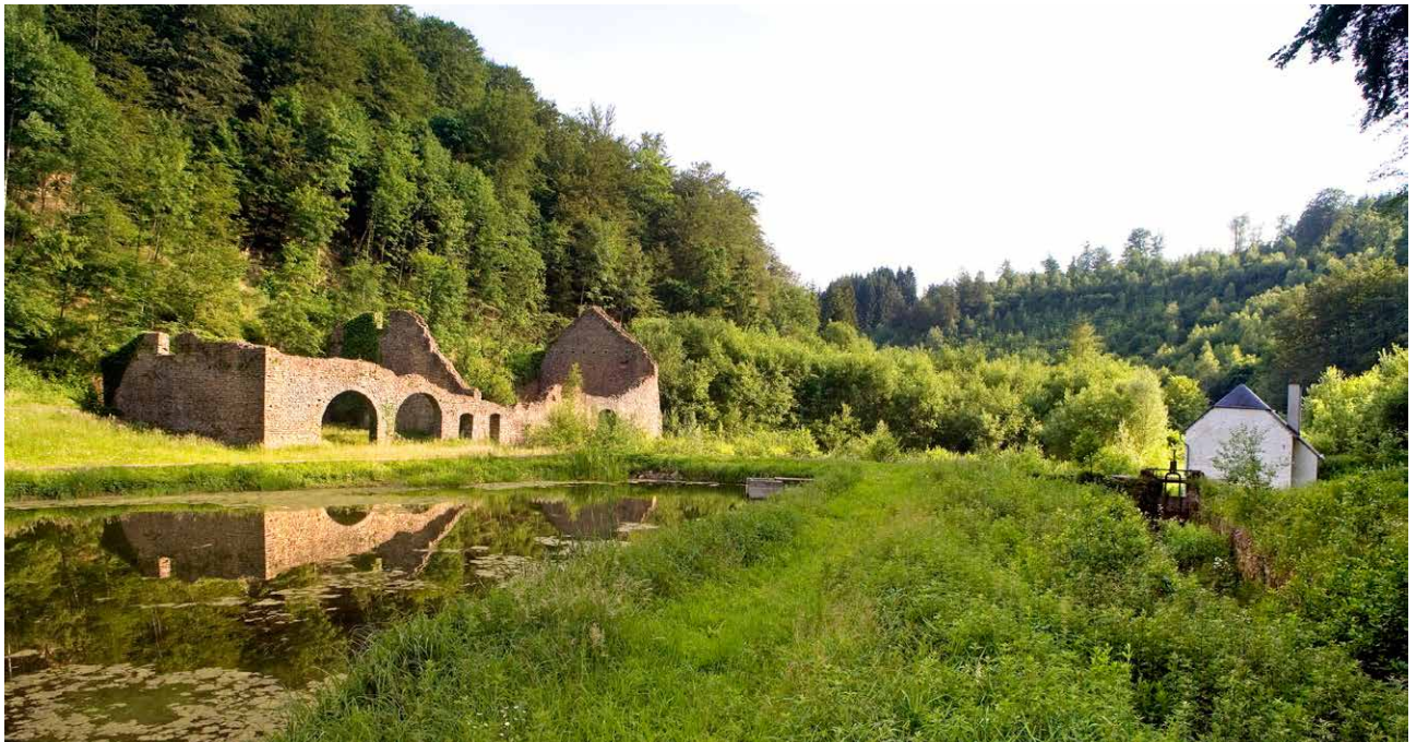
Site de Montauban-Buzenol