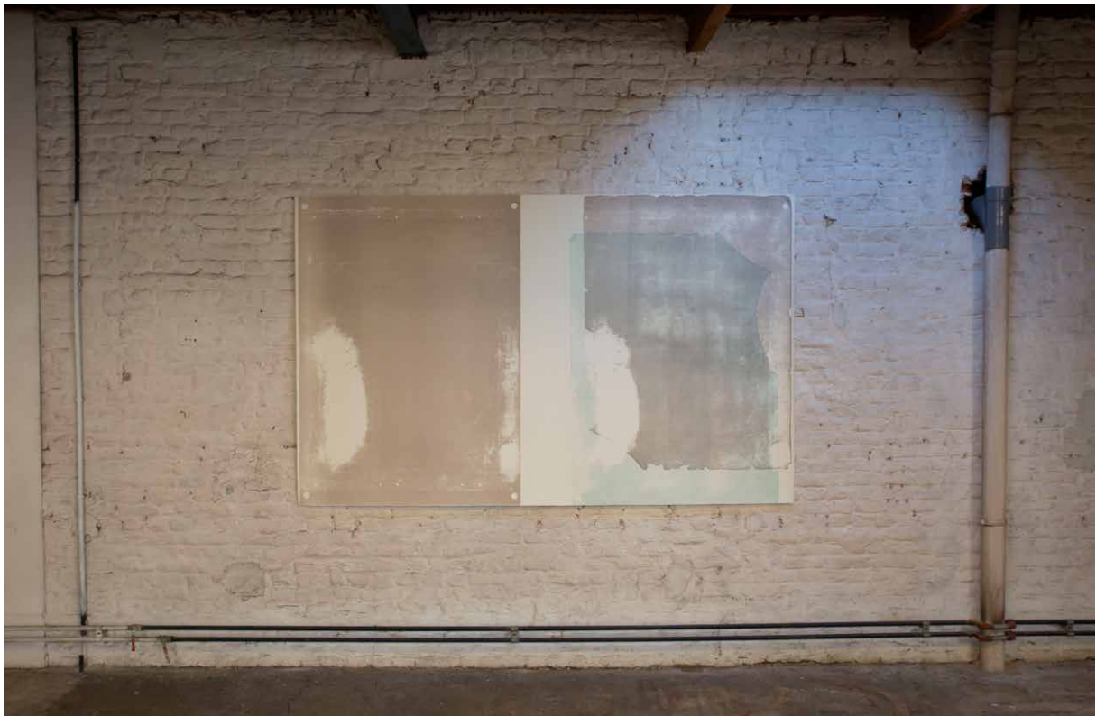
Yonghi Yim, Février (vue d'exposition), 2019. Monotype/lithographie, Somerset, 144 x 226cm