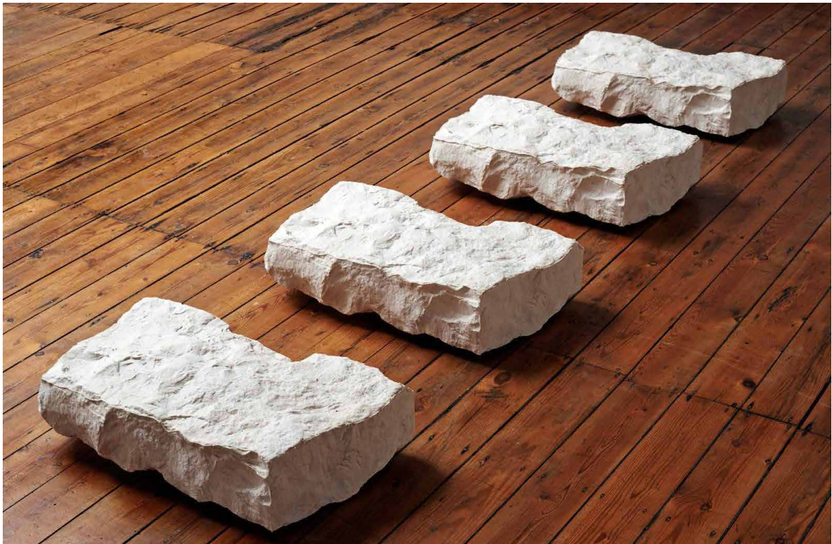
Hughes Dubuisson, Gemellus , 2014. Acrylique et fibre de verre, 64 x 36 x 17 cm (chaque bloc)