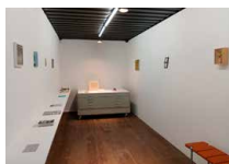
Espace René Greisch Rez-de-chaussée Artothèque