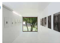
Espace René Greisch 2 e étage Laurent Schoonvaere