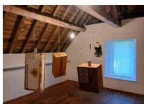
Bureau des forges Rez-de-chaussée + étage Stefan Bohnenberger