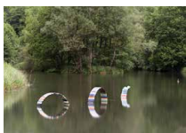
Étang Studio Biskt (Saison 2025)