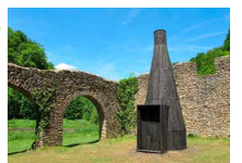
Halles à charbon Bento (Saison 2021)