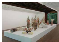
Espace René Greisch 1 er étage Sofi van Saltbommel