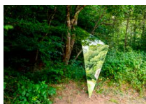
Autour des arbres Valérie Vogt (Saison 2020)