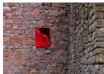
Halles à charbon Bernard Gilbert