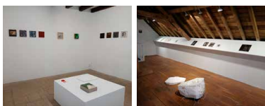
Bureau des forges Rez-de-chaussée + étage Artothèque