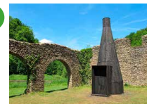
Halles à charbon Bento