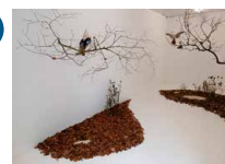
Espace René Greisch 2 e étage Élise Claudot