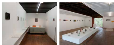
Espace René Greisch Rez-de-chaussée + 1 er étage Artothèque