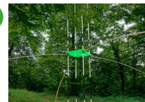
Espace extérieur Site archéologique Pierre Courtois