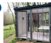
Container d'accueil Artothèque