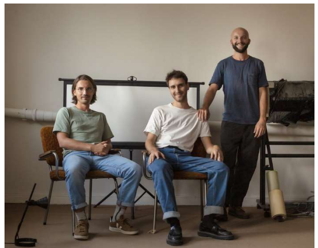
Bento Architecture.

Une organisation du CACLB (Centre d'Art Contemporain du Luxembourg Belge) en partenariat avec l'Association des Architectes de la Province de Luxembourg. Avec le soutien de Monsieur le Gouverneur de la province de Luxembourg.